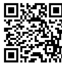
▲タイムズの駐車場予約サービス

URL: https://times-info.net/reservation/