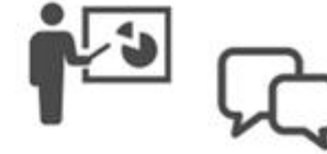
情報掲載に向けた研修