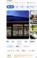
Googleビジネスプロフィール掲載例

・地域・観光関係事業者やDMOに対する情報掲載や地域サイトの運営体制等の構築に向けた研修を通じた普及啓発