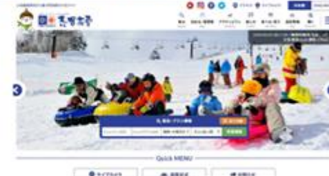
シームレスな情報発信・予約・決済が可能な地域サイト事例