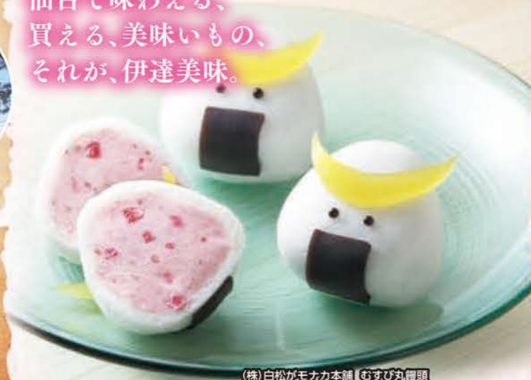
(株)白松がモナカ本舗 むすび丸饅頭