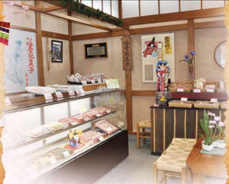
(有)元祖仙台駄菓子本舗 熊谷屋のお店内