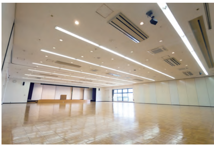
レセプションホール