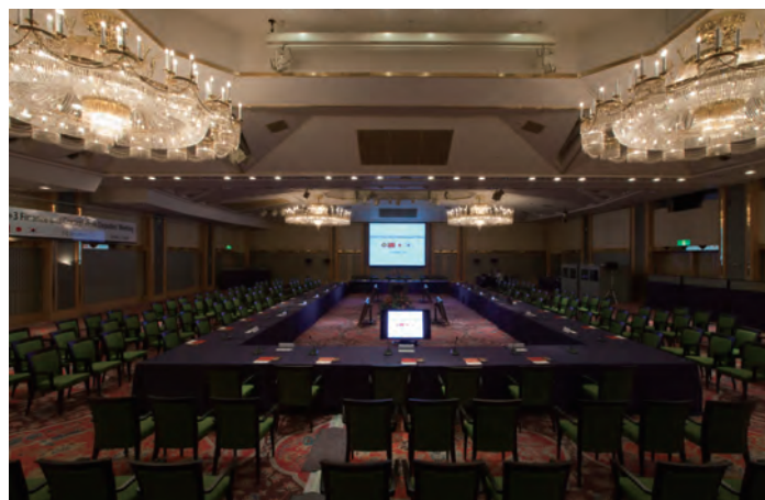
コンベンションホール宮城野