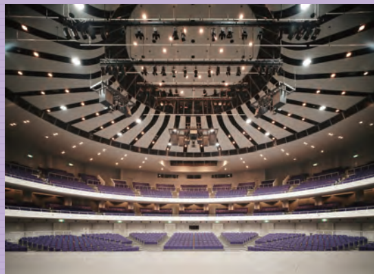
サンプラザホール

東北の武道館と称される「サンプラザホール」は東北最大のホールです。1 階の可動式床の構造により、大会・総会・コンサートのほか、レセプションホールとしても利用可能。併設するホテル棟を使用すれば宿泊・宴会場を加えて大型の集会を開催する事も可能です。