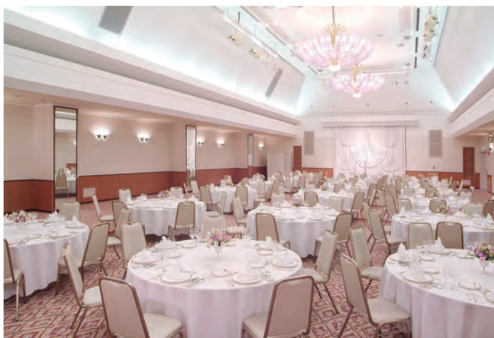
クリスタルルーム