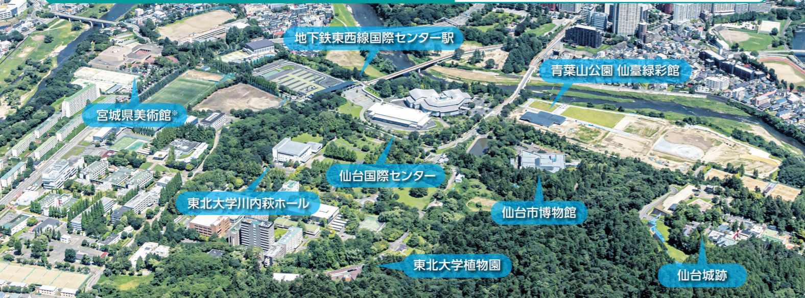
*宮城県美術館は改修工事のため休館中です。2026年夏ごろリニューアルオープン予定。

仙台のはじまりの地ともいえる青葉山エリアは緑豊かな自然の中に仙台国際センターをはじめとする文化施設が集まったMICEエリアです。