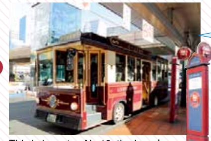
This is bus stop No.16, the Loople Sendai bus stop.