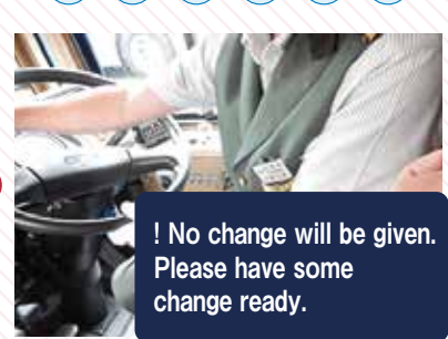
Make sure show the back side of your One-day Pass with the date to the driver. Single-ride passengers must pay the fare in cash or with an IC pass.