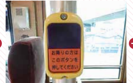
Press this button when you want to get off at the next stop.