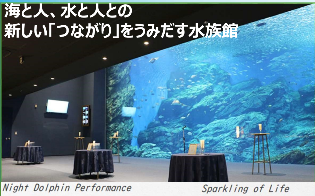
Night Dolphin Performance