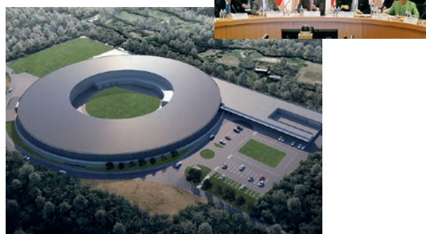
次世代放射光施設基本建屋完成予想図

「東北大学情報知能システム(IIS)研究センター」を設立したほか、本市の特性である学術・研究機関の集積を活かした技術交流などを通じ、新産業創出や市場拡大に注力。また、国内最大の国連会議となった第3回国連防災世界会議やG7仙台財務大臣・中央銀行総裁会議を開催するなど、コンベンション都市としての実績や経験が豊富です。