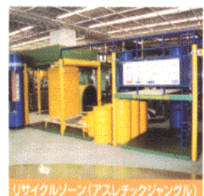
リサイクルゾーン(アスレチックジャングル)